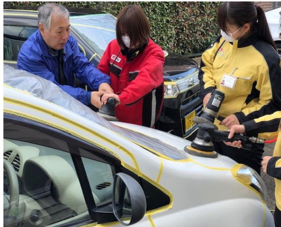
【洗車リーダー研修会】