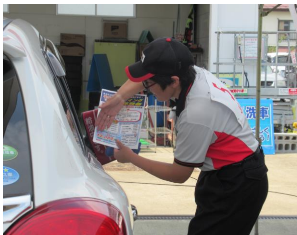
【給油所CSアップコンテスト】