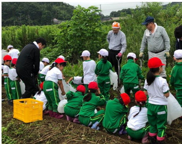
【地元小学生とのじゃがいも掘り体験】